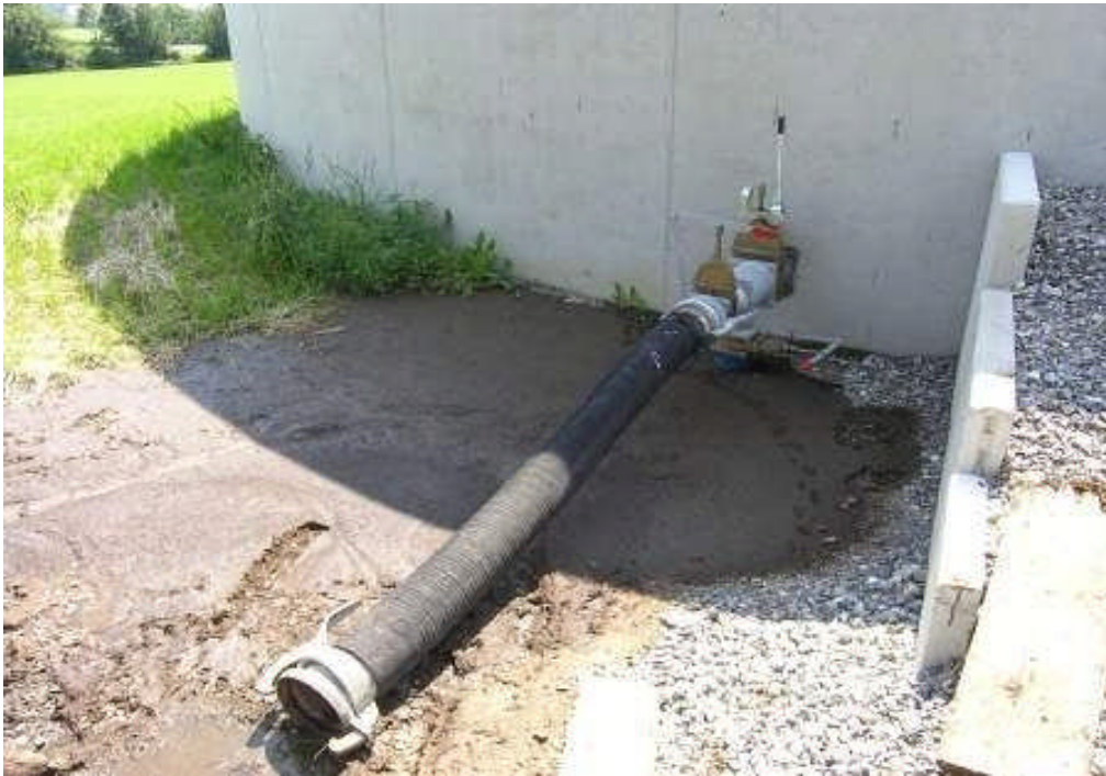
Ausgangspunkt des Malheurs