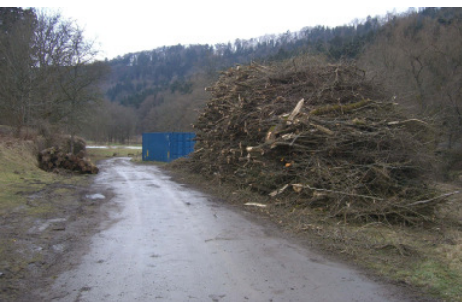
(Riesiger Berg von Schnittgut des WWA vor wenigen Tagen an der Eyach bei Mühringen. Das Stammholz wurde anderweitig entsorgt.)

Vielmehr vermute ich die hohen Holzpreise; das Schnittgut wird zwischenzeitig zerhäckselst und das Häckselgut von den Wasserwirtschaftsämtern für Heizkraftwerke verkauft!